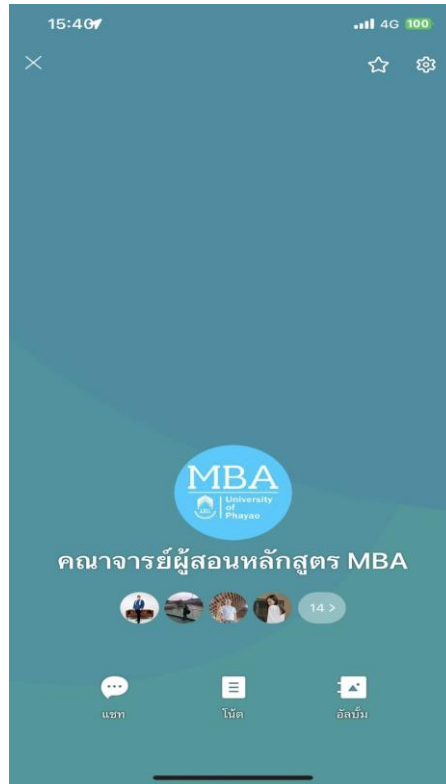
ภาพที่ 4 ห้องสนทนากลุ่มในสื่อสังคมออนไลน์ของอาจารย์ผู้สอน