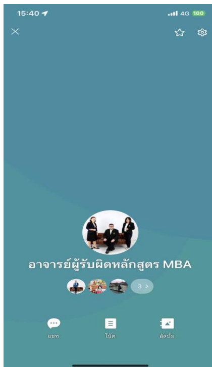
ภาพที่ 3 ห้องสนทนากลุ่มในสื่อสังคมออนไลน์ของอาจารย์ผู้รับผิดชอบหลักสูตร