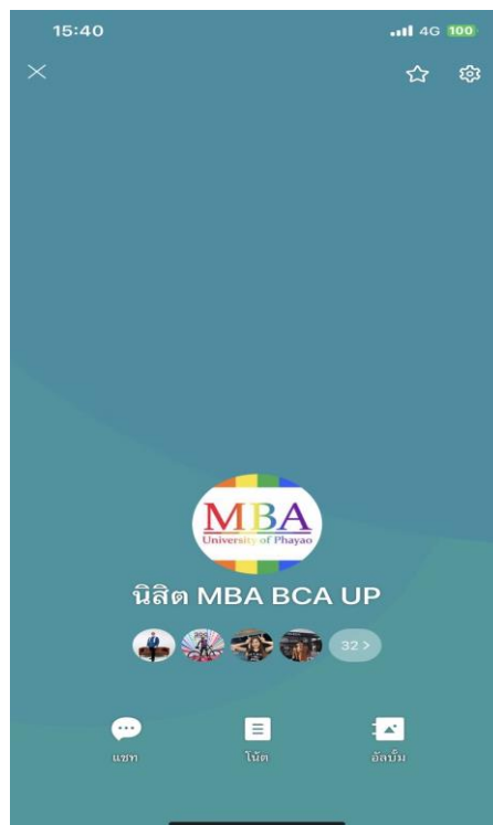
ภาพที่ 5 ห้องสนทนากลุ่มในสื่อสังคมออนไลน์ของอาจารย์และนิสิต